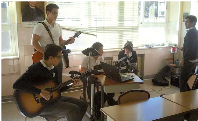
Uno de los grupos participantes en anteriores ediciones, ensayando en clase.

Las tres formaciones, seleccionadas de entre más de 200 bandas de todo el país, defendieron su música en directo, sobre el escenario de la denominada semifinal de la Zona D. Los tres actuaron junto a los semifinalistas de Zaragoza, el grupo 40 Grados, y junto al grupo que ocupó el quinto lugar de esta clasificación y que pertenecía a la localidad que acogió los conciertos de semifinales de este singular certamen. Todos ellos lucharon por un puesto en la gran final, que tuvo lugar en junio en Madrid. Finalmente, el grupo aragonés se impuso al resto, aunque los navarros demostraron su buen hacer en el mundo de la música.