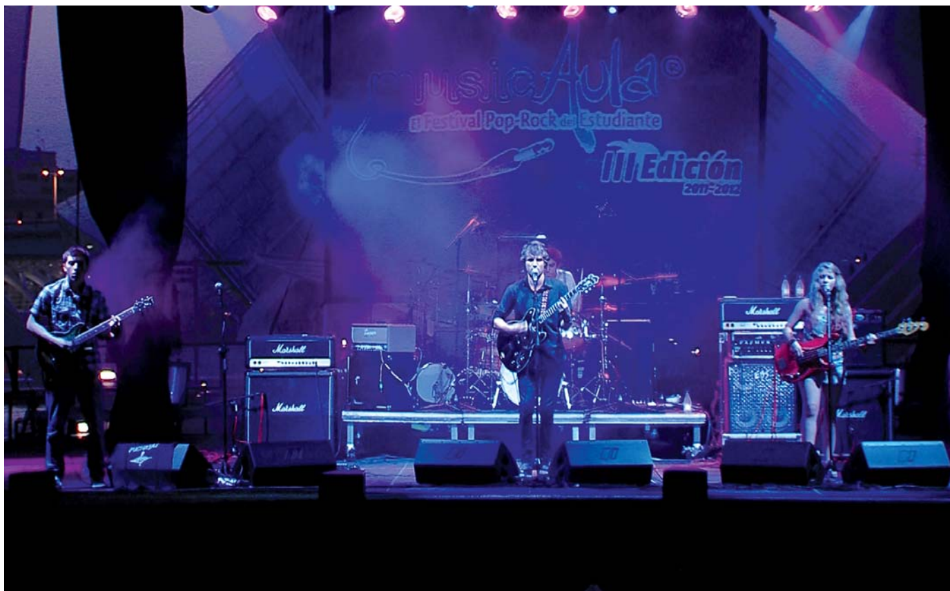
Actuación de uno de los grupos invitados en la gran final de la tercera edición, que tuvo lugar en junio de 2012.

Music Entertainment y del Festival MusicAula).